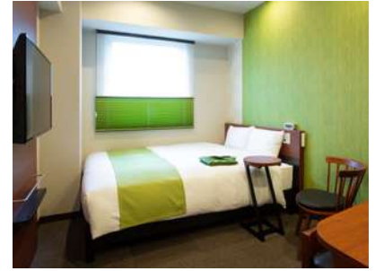
シングルルームイメージ