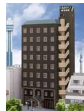
東京船堀 アクセスマップ