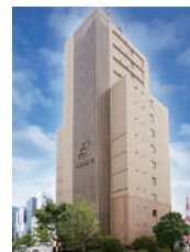
プレミアム浜松町 アクセスマップ